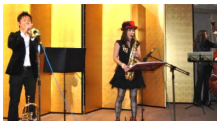
岡村トモ子とジャズグループ演奏