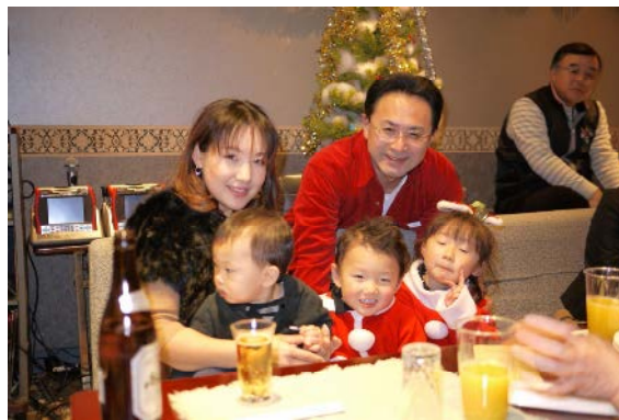
↑ 小さなサンタと大きなサンタ ↓