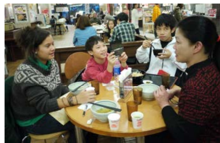
第1ホストファミリー、会長家族と