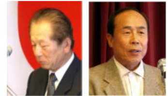
【進様、橋口様よりお礼のご挨拶】

貴団体は行橋ロータリクラブが主催する沓尾松山公園の清掃活動に際してその卓越した技術と豊富な経験を生かし献身的なご尽力をされました。これはロータリーの職業奉仕の精神を実践するものであります。ここにその功労に深く感謝し表彰いたします。