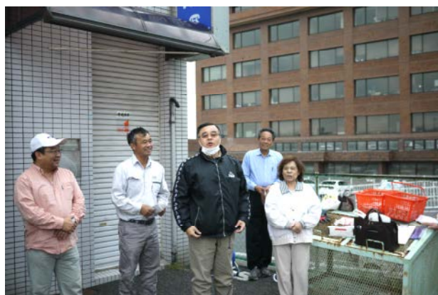
岡本社会奉仕委員長挨拶