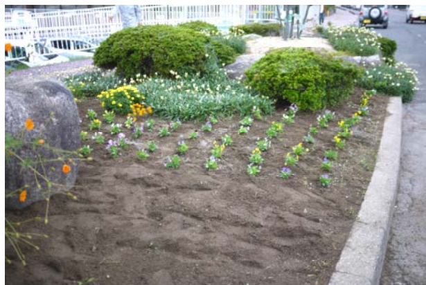
手前にチューリップの球根を植えました