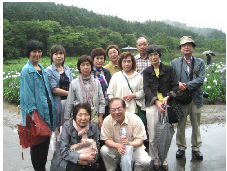
6月19日(日) 山翠会バス旅行 「神楽女湖の花しょうぶ」