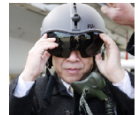
「パイロット用ヘルメット」 この人は誰でしょう？