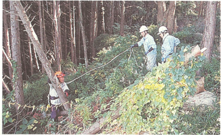
清掃作業で木を切り倒す参加者たち＝行橋市沓尾