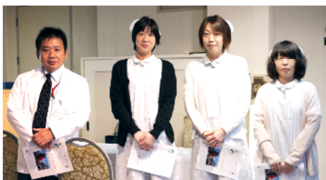
尾形クリニックの皆さまありがとうございました