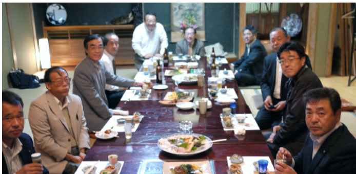
朝日新聞 安楽記者