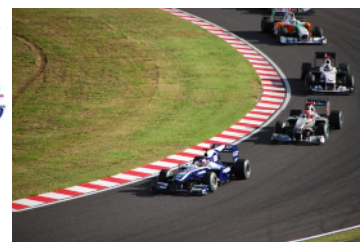
鈴鹿ペイIRCでメイクアップした福島会員、懇親会まで参加してきました。

友愛の広場 in SUZUKA 2010 October 8・9・10 鈴鹿ペイロータークラブ