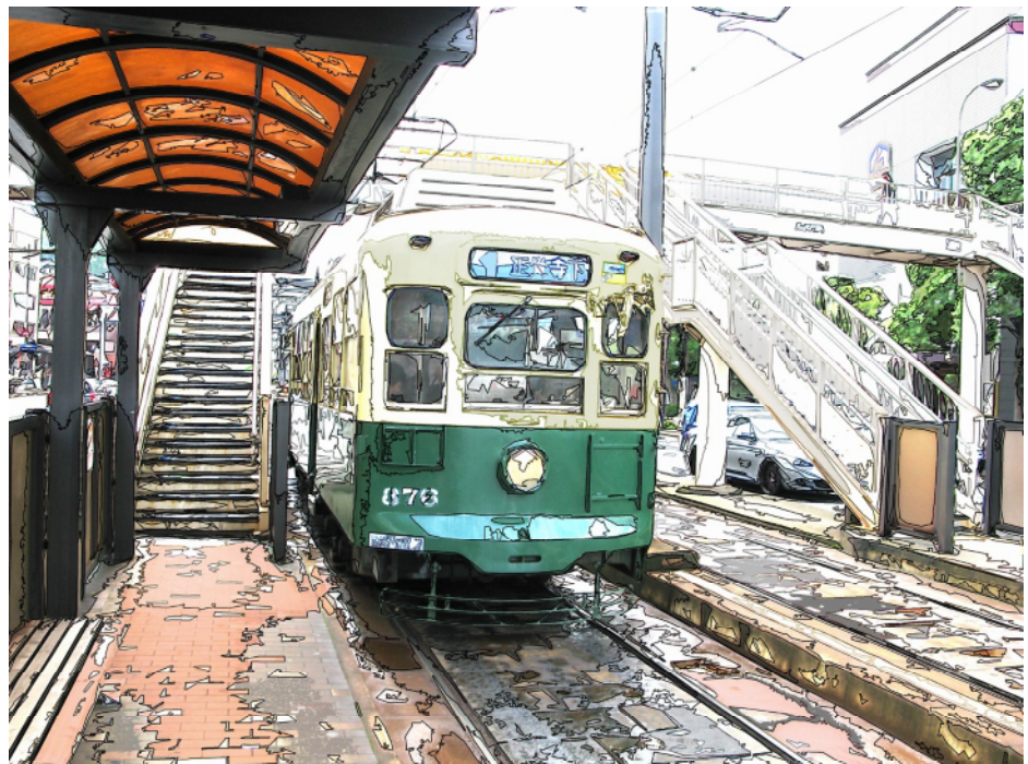
「長崎電気軌道」