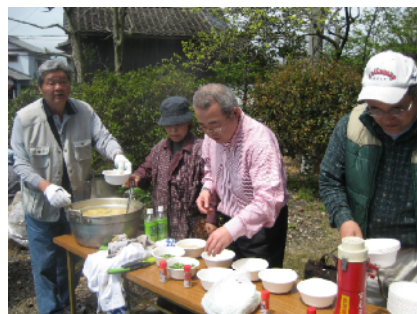
豚汁でおいしいお弁当タイム♪