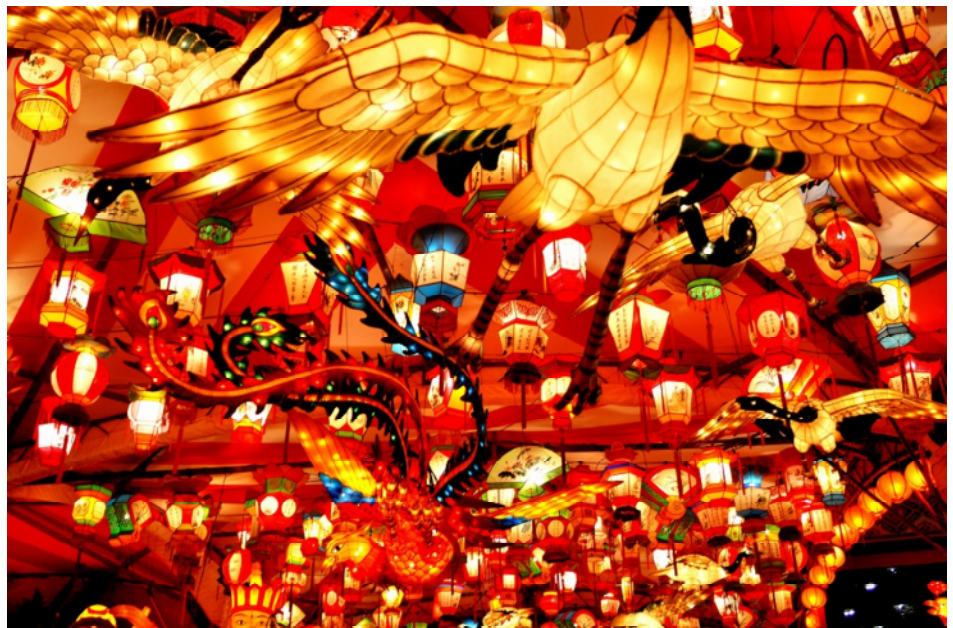
「長崎ランタンフェスティバル」

20日(土) PETS(会長エレクト研修セミナー) 23日(火) 休会(定款規定により) 27日(土) 第24回第1グループゴルフ大会 9:36スタート 周防灘カントリークラブ 28日(日) 第124回近隣4クラブ囲碁大会 10:00~ 紀文(東築城116-1) 30日(火) 夜間例会/花見例会(日程、場所未定) 4月18日(日) 地区大会 9:30~17:30 アクロス福岡 24日(土) 豊前RC創立50周年記念式典 14:30~19:00 グランプラザ中津ホテル