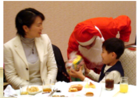
若山サンタさんからプレゼント