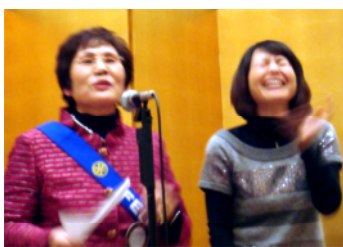
安本親睦委員長、司会お疲れさまでした!! (お嬢様と)