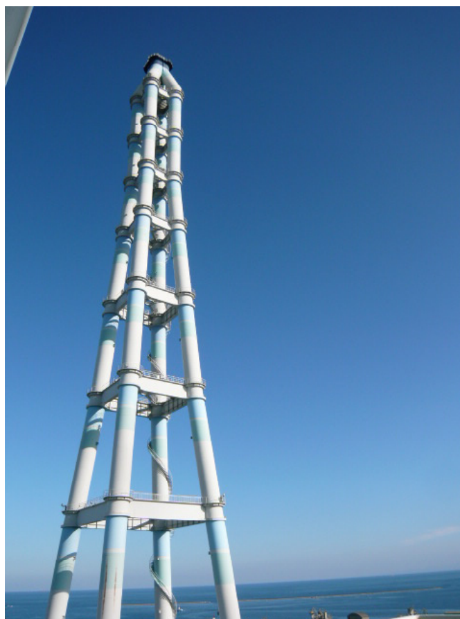
九電(株)苅田発電所 高さ201mの煙突