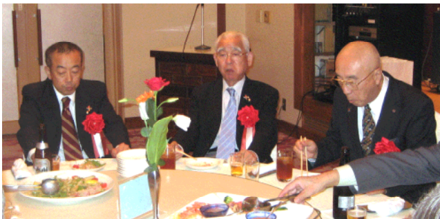
皆さま大変お疲れさまでした！