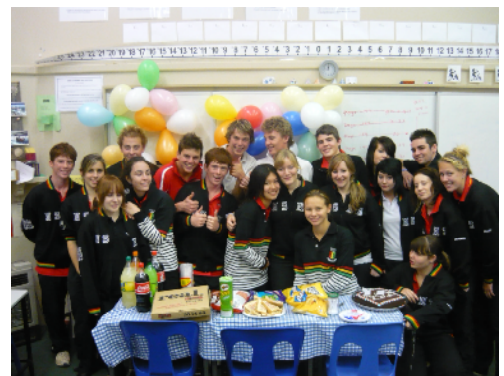
数学クラスの送別会