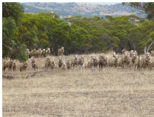
ホストファミリーの羊