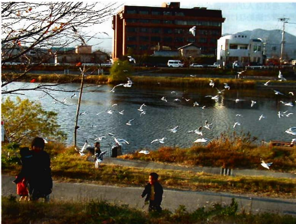
「今川とゆりかもめ」