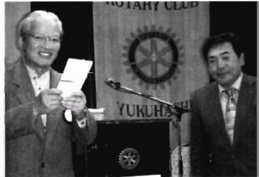
尾形先生、スタッフの皆様 ありがとうございました。