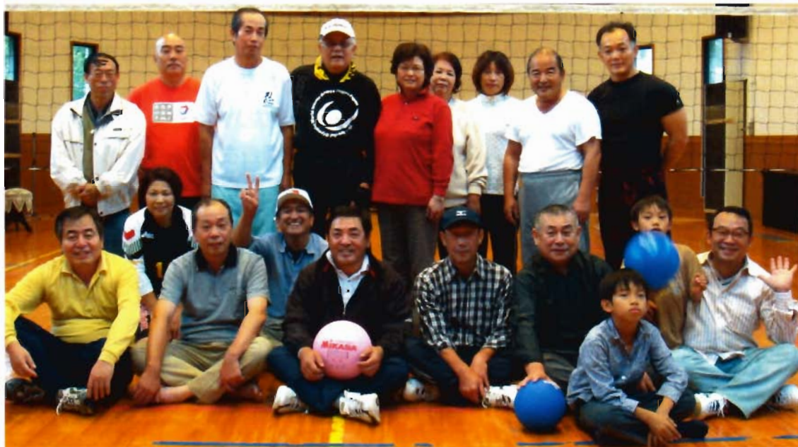
ソフトバレー例会(11月16日・源じいの森にて)